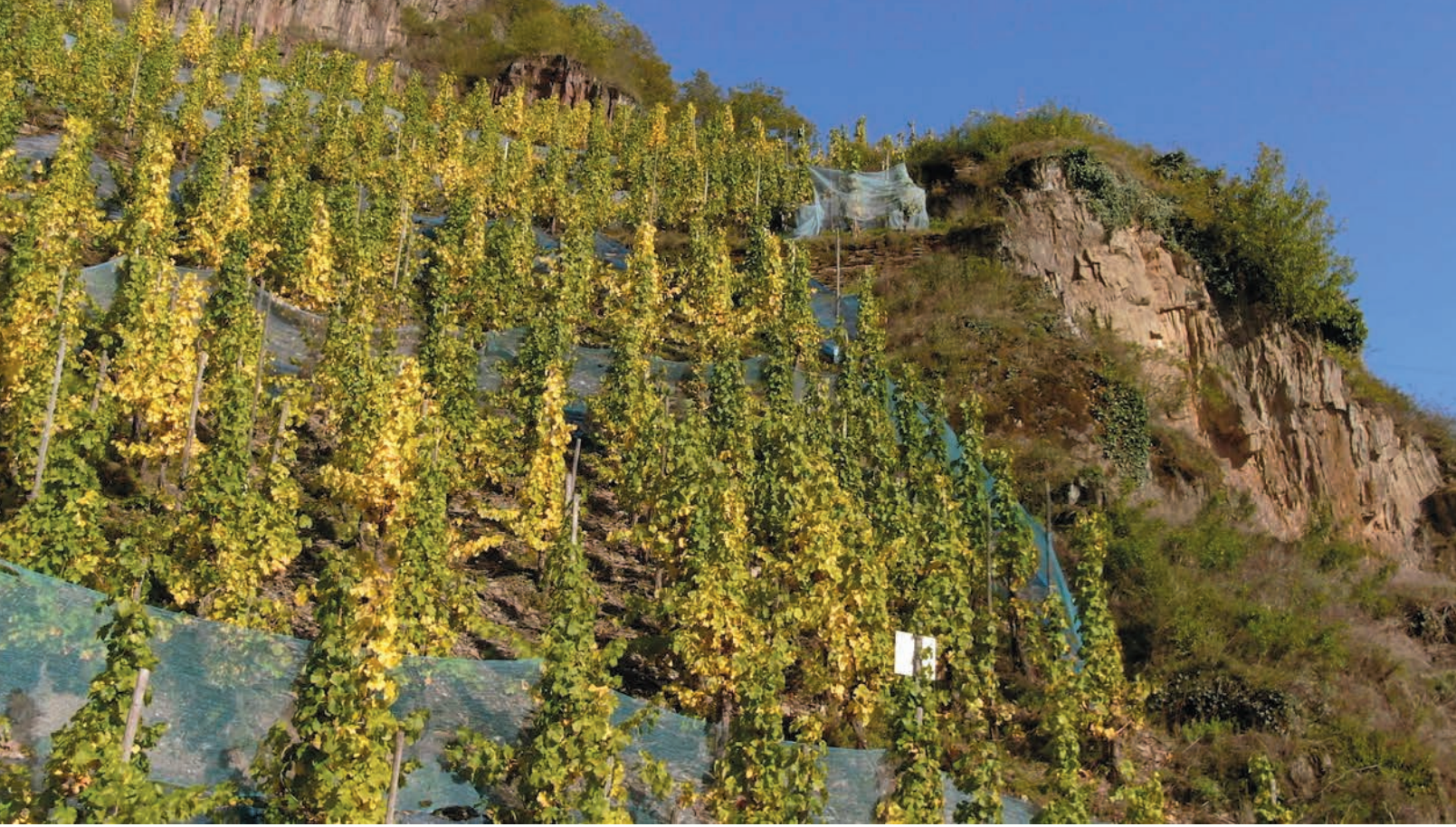
Parcelle Marienburg, très abrupte, chez Clemensbusch

À la fin du 19 e siècle, alors que le reste de l'Allemagne est ravagé par le phylloxéra (voir p. 124), la Mosel s'en tire bien en raison de la composition de ses sols qui crée un environnement peu favorable aux insectes. Il n'en demeure pas moins que l'industrialisation du pays a pour effet de vider la campagne de sa main-d'œuvre. Ayant de plus en plus de difficultés à produire des vins de qualité, un grand nombre de domaines commencent à prendre des raccourcis. On observe alors un recours répandu à la chaptalisation, soit l'ajout de sucre dans le moût de raisin qui permet d'augmenter son potentiel alcoolique. Cette pratique sera interdite en 1930, alors que le gouvernement allemand met à jour sa loi sur le vin, visant également à limiter l'importation de vins étrangers.