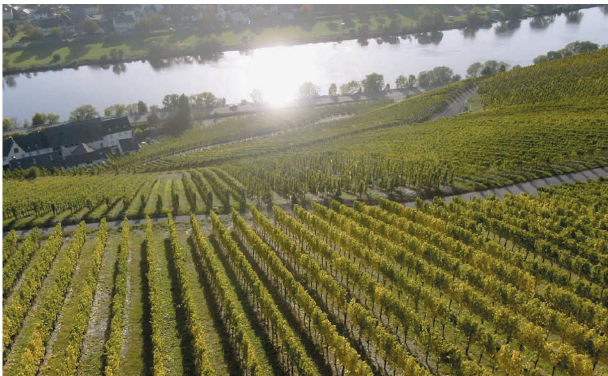
La Mosel, en contrebas, réfléchit les rayons du soleil et les redirige vers les vignes. C'est la particularité de la région.

Les meilleurs vignobles sont ceux exposés plein sud afin de profiter du plus de soleil possible, ainsi que de la réflexion de la lumière sur le cours d'eau. Ces parcelles sont également souvent plantées dans des escarpements très abrupts, rendant le travail extrêmement difficile et, bien souvent, impossible à mécaniser, mis à part des systèmes sur rails pour le transport de l'équipement et des raisins. On évalue la charge de travail manuel à 1 500 heures par hectare, par année, ce qui représente le double d'une région voisine en terrain plat comme Pfalz.